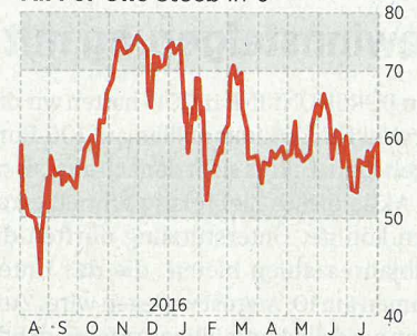
All For One Steeb in €

Euro, die Marge verschlechterte sich von acht Prozent im Vorjahr auf aktuell 7,3 Prozent. Der Druck auf die Gewinnspanne ist dem vermehrten Einsatz externer Dienstleister geschuldet, um der hohen Nachfrage gerecht zu werden. Wenn die externen Helfer weniger gebraucht werden, sollten Marge und Gewinnwachstum wieder anziehen. Denn während die Kosten für ausgeliehene Mitarbeiter sofort anfallen, spielen die Wartungsverträge ihre Umsätze erst über die Zeit ein. Da der Aktienkurs zuletzt seitwärts lief, stufen wir die Aktie – trotz der weiterhin hohen Nachfrage – auf „Beobachten“ zurück. PRL