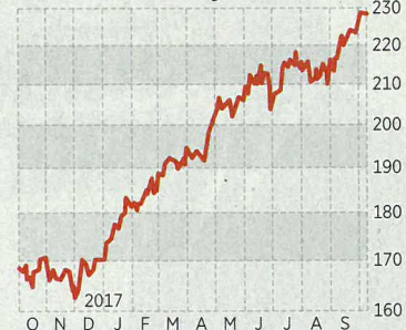
Mainfirst Germany in €

Der Bereich Technologie ist freilich auch im Mainfirst Germany gut vertreten. Rund 27 Prozent machen Unternehmen der IT-Branche darin aus. Zu den Top Ten des 30 Werte umfassenden Portfolios zählen etwa All for One Steeb, Cenit, Atoss Software und Mensch und Maschine . Generell setzen Eichler und Co gern auf deutsche Mittelständler, die global wachsen können. Häufig finden sie diese im Bereich Maschinenbau, aber eben auch bei Unternehmen der Softwarebranche. AH